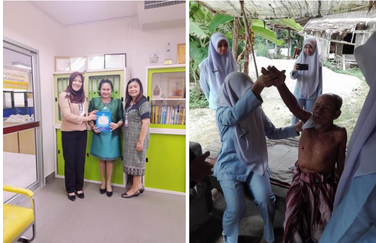
รูปที่ 1,2 การจัดกิจกรรม