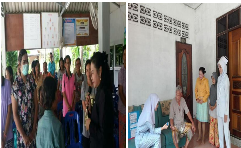
รูปที่ 5, 6 การจัดกิจกรรม

ระยะที่ 2 อบรมเชิงปฏิบัติในการให้ความรู้และทักษะเบื้องต้นในการใช้ นวัตกรรมแอนิเมชันเพื่อป้องกันภาวะซึมเศร้าของผู้สูงอายุมุสลิม โดยใช้หลักมิติจิตวิญญาณด้านความมั่นคงของมนุษย์