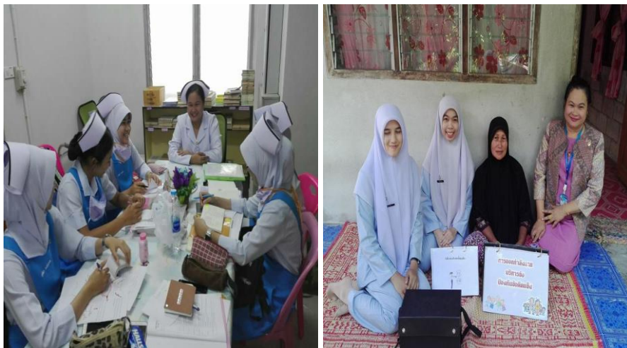
รูปที่ 3, 4 การจัดกิจกรรม